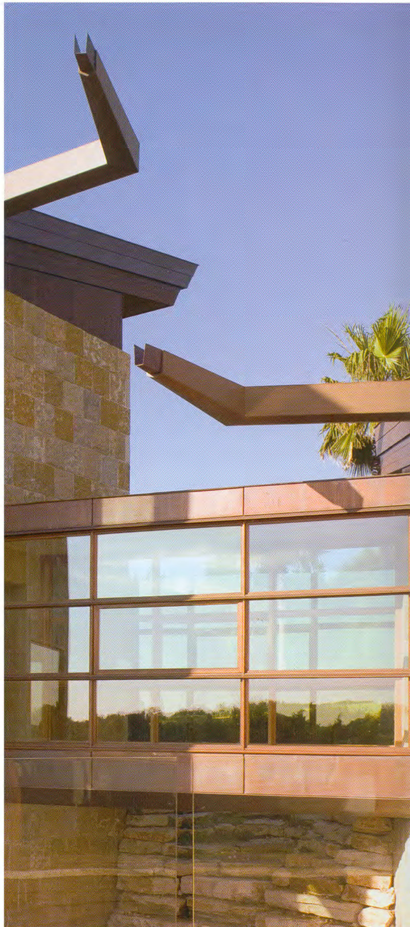
Este puente cubierto es una de las zonas de paso que conecta los pabellones. La transparencia de la galería permite disfrutar de las vistas en casi todas las direcciones. Al salvarse el desnivel del terreno se consiguió que la superficie edificable fuera mayor.